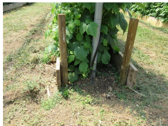
Abb.1: Holzverschalung bei Himbeeren

kontinuierliche Wasserversorgung. Zwar vertragen sie durchaus Trockenperioden gut, jedoch hat dies ein vermindertes Frucht- und Pflanzenwachstum zur Folge. Da die Stachelbeere ihre Früchte am letztjährigen Holz bildet, hat ein schwaches Triebwachstum in diesem Jahr automatisch einen geringen Ertrag im nächsten Jahr zur Folge. Deshalb empfiehlt sich bei ausbleibendem natürlichem Niederschlag eine Zusatzbewässerung vor allen in den Monaten April, Mai und Juni, da zu dieser Zeit zum einen die Früchte versorgt werden müssen und zum anderen fast das komplette vegetative Wachstum stattfindet.