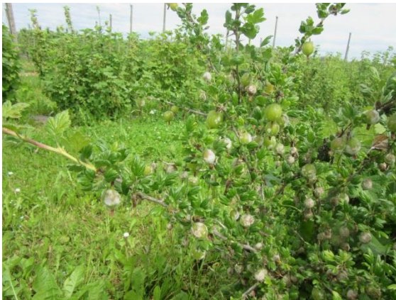
Abb.2: Mehltaubefall an Früchten

Folgejahre auswirkt. Als Gegenmaßnahmen empfiehlt es sich, befallene Triebe sofort abzuschneiden und zu entsorgen. Dadurch kann eine weitere Ausbreitung verhindert werden. Alternativ kann man Austriebsspritzungen mit Schwefelpräparaten vornehmen. Allerdings ist hier Vorsicht geboten, denn die jungen Blätter reagieren je nach Sorte teilweise sehr empfindlich und es kann zu Blattschädigungen kommen.