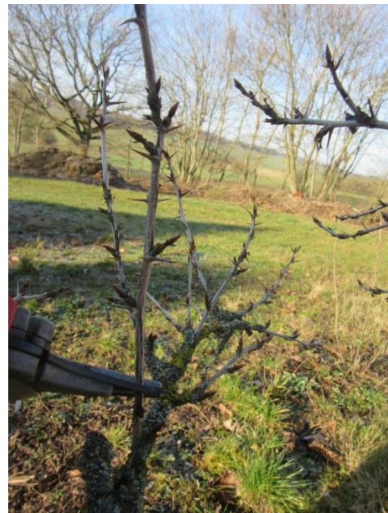
Abb.5. Zapfenschnitt beim Stämmchen

die Seitentriebe an denen dieses Jahr Früchte geerntet wurden, im Winter auf einen Zapfen mit ungefähr drei bis vier Augen zurückgeschnitten. Ziel ist es pro Leittrieb ca. acht bis zehn Seitentriebe zu haben. Überzählige Seitentriebe werden ebenfalls auf einen Zapfen zurückgeschnitten. Bei jungen Pflanzen in den ersten zwei Standjahren, ist es vom Vorteil die Anzahl Seitentriebe weiter zu reduzieren, um das Wachstum der Pflanzen zu verbessern. Durch diese Maßnahmen lässt sich über viele Jahre ein ausgeglichenes Verhältnis von Wachstum und Fruchtertrag erreichen.